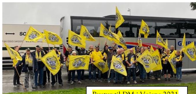
Bustur til DM i Vojens 2021